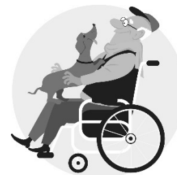
Un chien de thérapie pour les personnes âgées