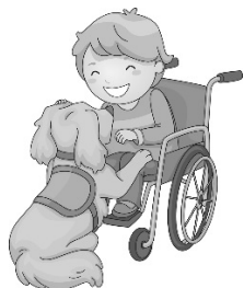
Un chien de thérapie pour les enfants