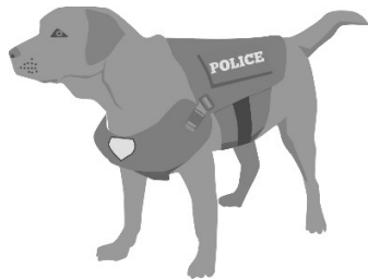
Un chien policier