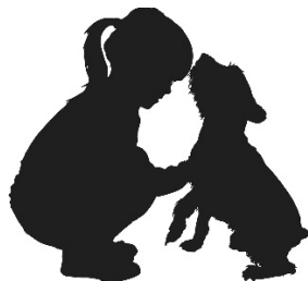
Un chien de compagnie