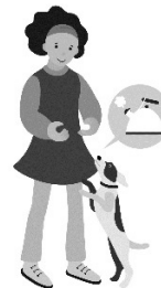
Un chien-guide pour les personnes sourdes ou malentendantes